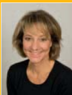
Petra Klein Radio Moderatorin des SWR 1